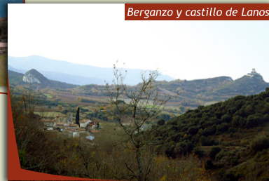
Berganzo y castillo de Lanos