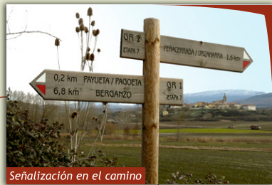
Señalización en el camino