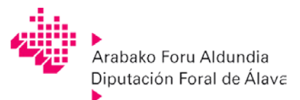
Arabako Foru Aldundia Diputación Foral de Álava